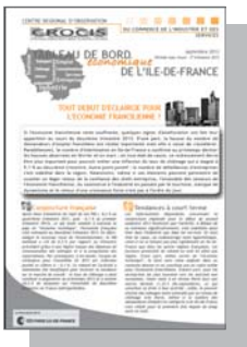
Tableau de bord économique de l'Ile-de-France

2 e trimestre 2013 : Tout début d'éclaircie pour l'économie francilienne ? (parution septembre 2013)